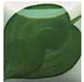
EZ 033 Ivy Green