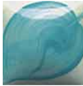
EZ 054 Papago Turquoise