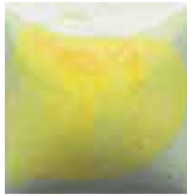
EZ 025 Lemon Yellow