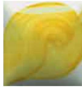
EZ 004 Willow Yellow