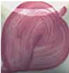
EZ 052 Pecos Pink