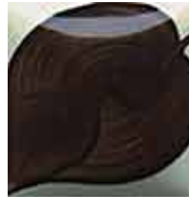
EZ 010 French Brown