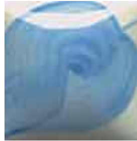
EZ 031 Light Blue