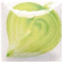
NEW! EZ 105 Neon Green