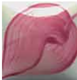
EZ 008 Ruby Red