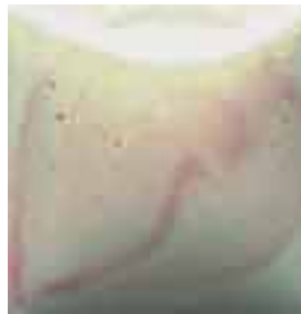
EZ 002 Cinderella Pink