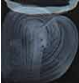
EZ 013 White