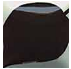
EZ 039 Dark Brown