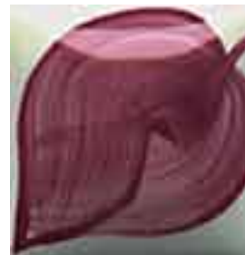
EZ 020 Mulberry