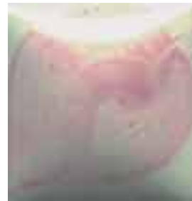
EZ 061 Petal Pink