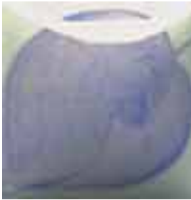
EZ 065 Periwinkle