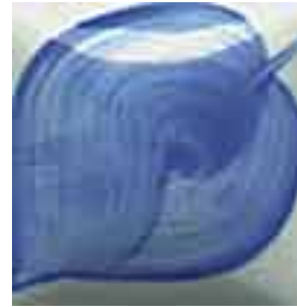
EZ 066 Morning Glory