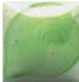
EZ 003 Irish Green