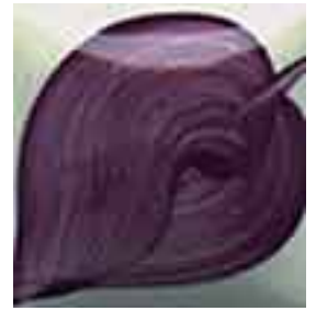
EZ 064 Concord Grape