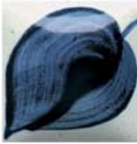
EZ 074 Dark Navy