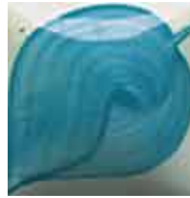
EZ 032 Peacock Green