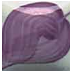
EZ 007 Royal Purple