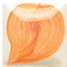
NEW! EZ 104 Neon Orange