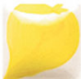
NEW! EZ 101 Neon Yellow