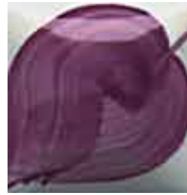
EZ 050 Pueblo Purple