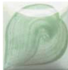
EZ 072 Romaine