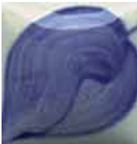
EZ 035 Dutch Blue