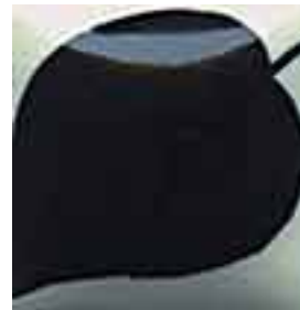
EZ 012 Cobalt Jet Black