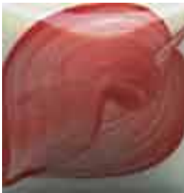
EZ 056 Brick Red