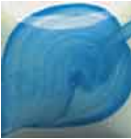
EZ 027 Navajo Turquoise