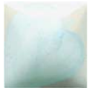
EZ 069 Azure Blue