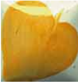
EZ 034 Orange