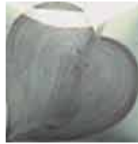
EZ 067 True Taupe