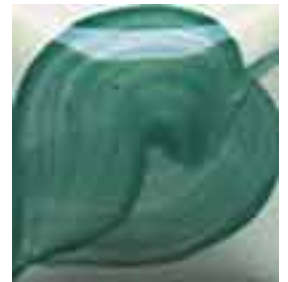
EZ 053 Hacienda Jade