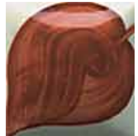
EZ 055 Indian Summer