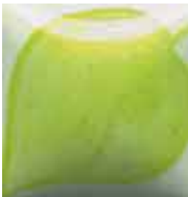
EZ 018 Chartreuse