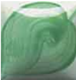
EZ 043 Mint Julep