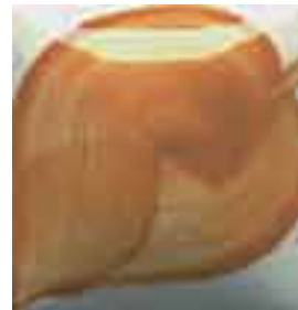
EZ 048 Mesa Clay