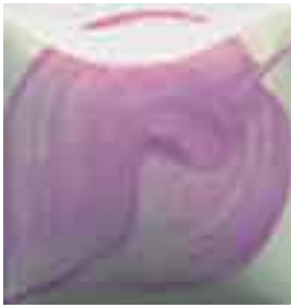
EZ 051 Santa Fe Sunset