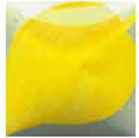
EZ 026 Yellow Orange