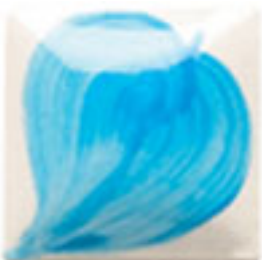
NEW! EZ 102 Neon Blue