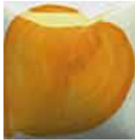
EZ 005 Sierra Yellow