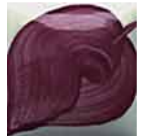
EZ 063 Wine Berry