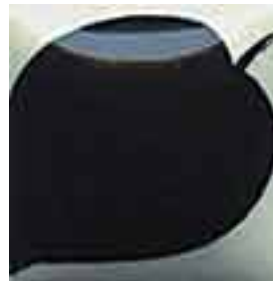
EZ 037 Black