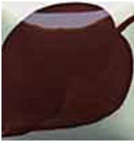
EZ 068 Roasted Chestnut