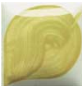
EZ 070 Olive Green