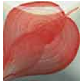
EZ 057 Coral Red