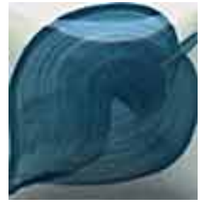
EZ 042 Teal