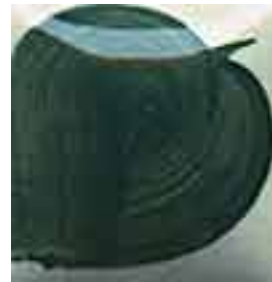
EZ 024 Royal Blue Green