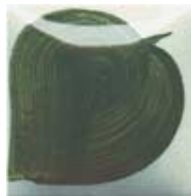
EZ 071 Dark Olive