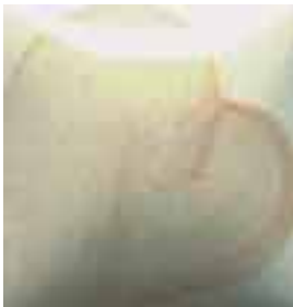
EZ 022 Flesh Tone