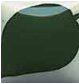
EZ 016 Grass Green