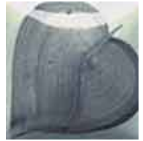
EZ 019 Smoke Grey