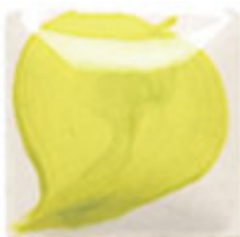
NEW! EZ 103 Neon Chartreuse