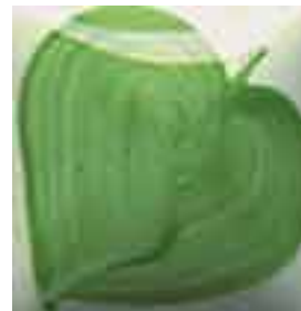
EZ 028 Leaf Green