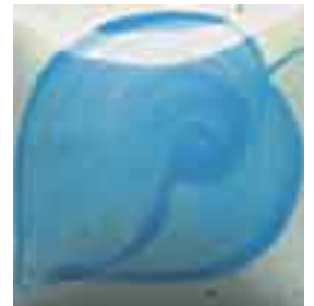
EZ 017 Dark Turquoise