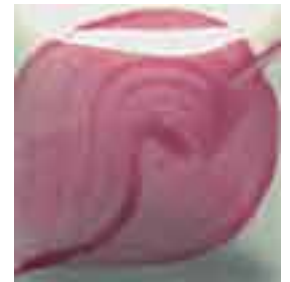
EZ 030 Rose