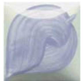
EZ 073 Violet