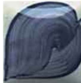
EZ 041 Denim Blue