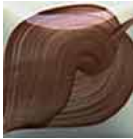
EZ 038 Medium Mahogany