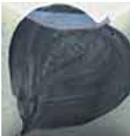
EZ 047 Thundercloud Grey