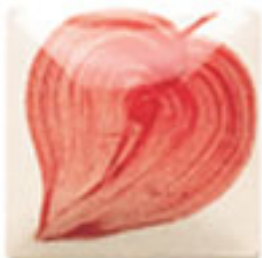
NEW! EZ 075 Passion Red