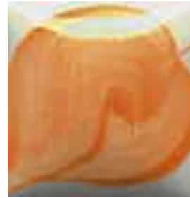
EZ 058 Poppy Orange