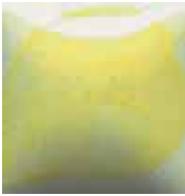
EZ 059 Buttercream