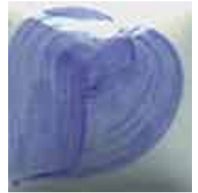
EZ 006 Forget-Me- Not Blue