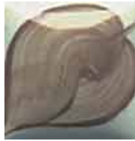
EZ 044 Cobblestone