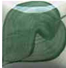
EZ 014 Jade Green