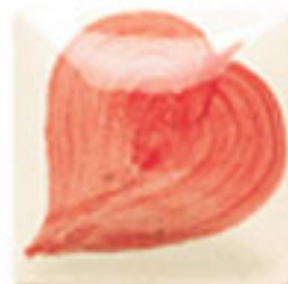
NEW! EZ 106 Neon Red